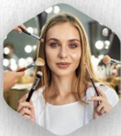
MAKE UP ARTIST

UNE ATTESTATION SERA DÉLIVRÉE À LA FIN DE LA FORMATION